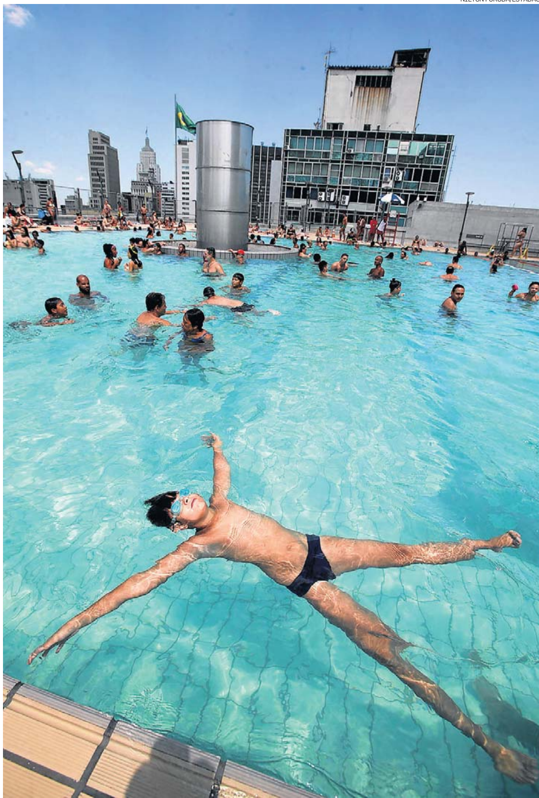
Sesc 24 de maio, no centro. Fenômeno climático faz com que haja menos nebulosidade

Verão carioca. O Rio teve o janeiro mais quente desde que o Instituto Nacional de Meteorologia começou a medir as temperaturas, em 1922. A média das máximas diárias, registradas na estação de medição de Santa Cruz (zona oeste), chegou a 37,4°C, três décimos acima do recorde anterior, que era de 37,1°C, registrado em 1984. COLABOROU FÁBIO GRELLET